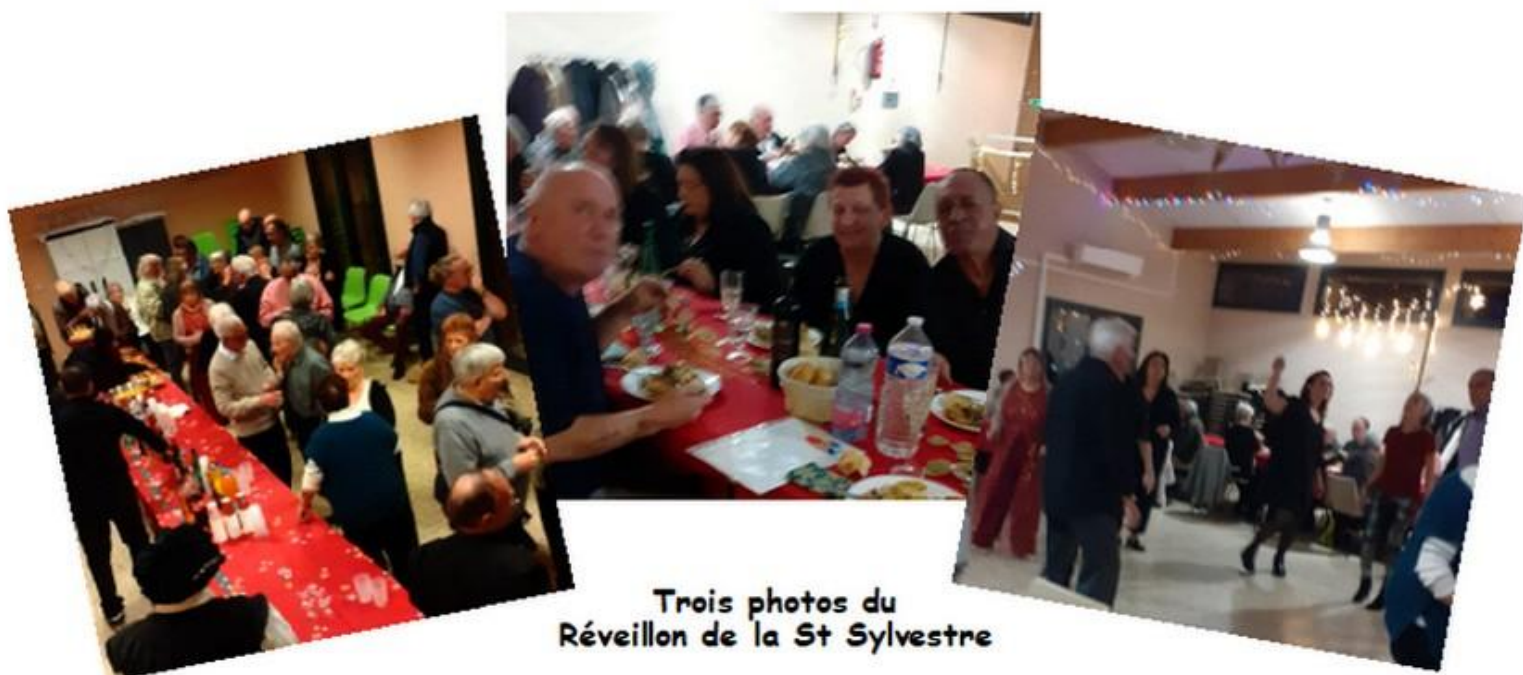
Trois photos du Réveillon de la St Sylvestre

Merci à tous pour votre participation en 2025 !!!